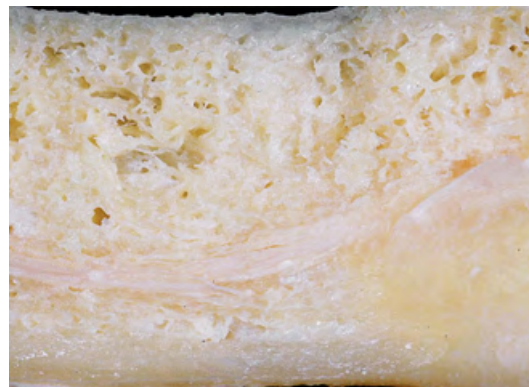
Zdrowa kość żuchwy.

Procesy toczące się w FDOK kości szczęki/ żuchwy można porównać do małych fal, które nieustannie, delikatnie uderzając o brzeg, pomimo niskiego poziomu aktywności, powoli, ale systematycznie, zmywają plażę przez lata, doprowadzając do jej degradacji. W FDOK cytokiny RANTES (CCL-5) odgrywają dominującą rolę. Podwyższone wartości RANTES można zaobserwować w stanach zapalnych stawów lub reumatoidalnym zapaleniu stawów, stwardnieniu